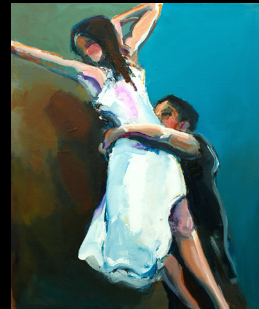
Lisbeth Ellinor - Pina - 80 x 100 cm

Vi glæder os meget til at vise dig "PINA" en sprudlende udstilling, som vi håber må give dig/jer ny inspiration til alt det skønne i livet. Velkommen til "PINA" .