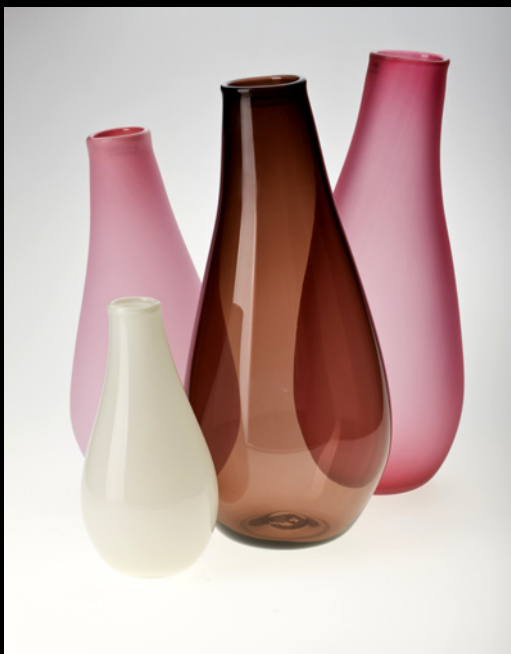
Bente Sonne - Vaser - Rødlige Tumlinger