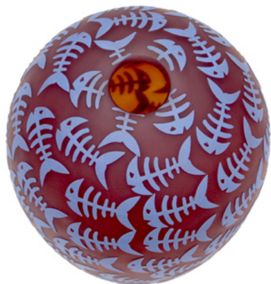
Bente Sonne - Krukke med blå fiskeskeletter

Separatutstilling med maler Lisbeth Ellinor og glasblæser Bente Sonne