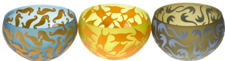
Bente Sonne - 3 skåle