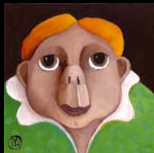
Erika - 15 x 15 x 6 cm

Galleri Uggerby, Strandvejen 89, Lønstrup, 9800 Hjørring