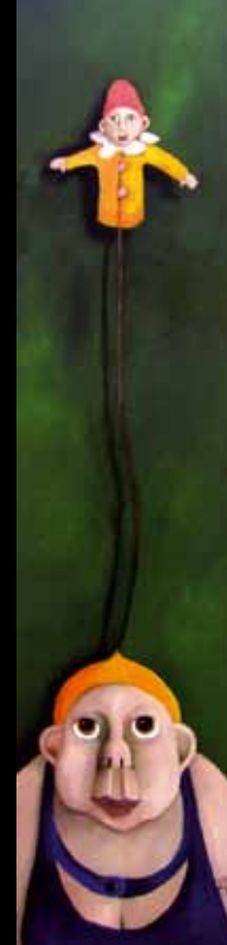
Dukken - 100 x 23 cm