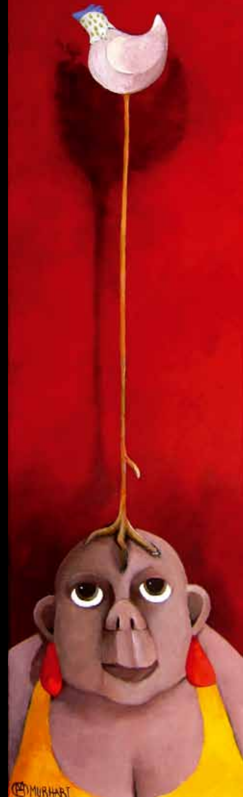
Hønemor - 100 x 23 cm