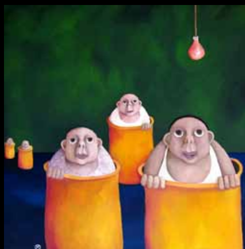
Ståsted - 80 x 80 cm