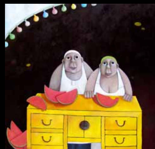
Melonfest - 110 x 120 cm