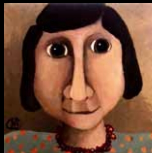
Liddia - 15 x 15 x 6 cm