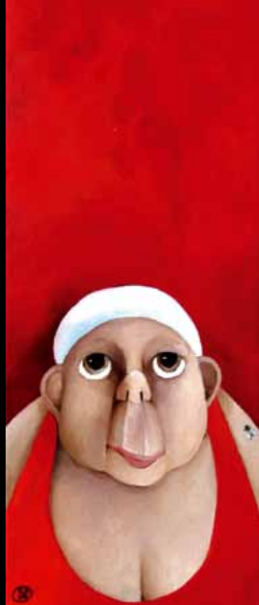
Pigen i rødt - 50 x 20 cm