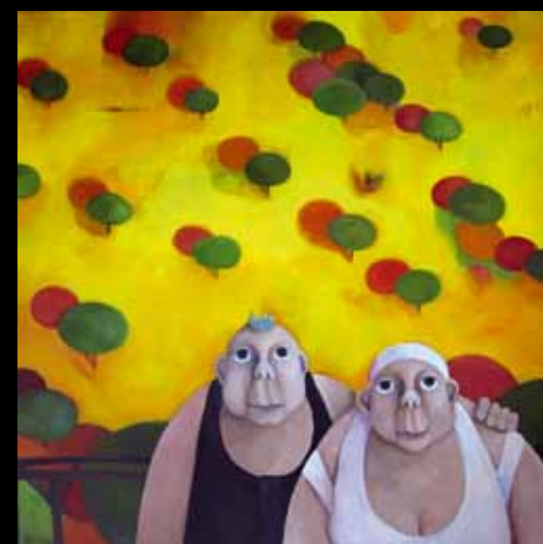
Olivenkongen - 100 x 100 cm