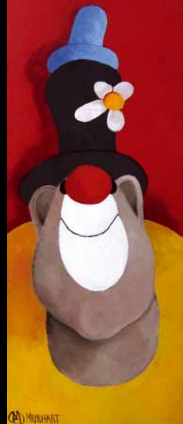
Klovnen Titus - 50 x 20 cm